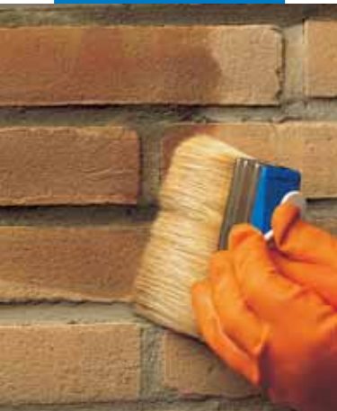
Нанесение Antipluviol S кистью